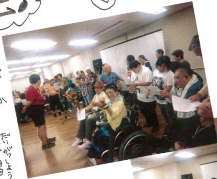
愛は勝つの大合唱