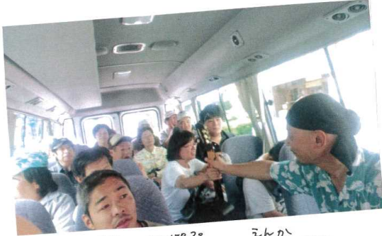
バスの中にて、J-POPから演歌まで、 いろんな歌を歌いました。

9月2日、総勢約30名で、共同連大会に行ってきました。バス、電車、ワイワイガヤガヤ☺草津の立命館大学びわこくさつキャンパス! この日みなさんの模様を写真をとって、ダイジェストでお届けします~!