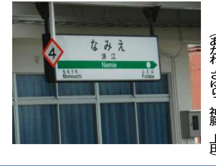
(あかね さゆり 神藤 上田

う。2号機は他の原子炉より放射線レベルが低いそうだが2号機の調査も失敗している。大量の核ゴミの問題、敷地内のタンクの汚染水の問題、莫大な廃炉費用の問題などが見えない。それでも政府は原発再稼働を今なお推し進めている。東電の柏崎刈羽原発の6、7号機が再稼働の前提となる審査に合格したと報じられている。福島第一原発と同じタイプの沸騰水型だ。ご都合解散した衆議院の総選挙、この会報が出る頃は原発推進か脱原発か、結果が出ているのだ。