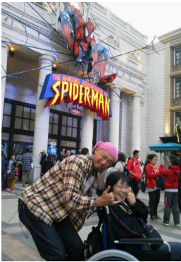
USJ、スパイダーマン館前にて