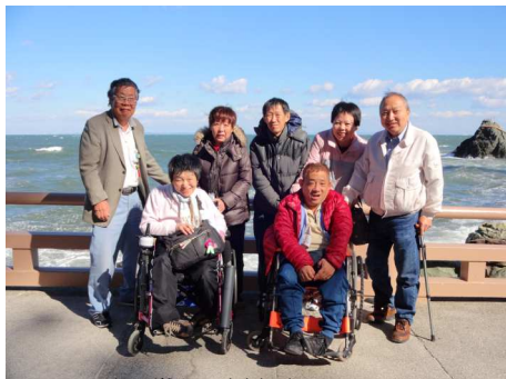
二見浦、夫婦岩にて

戻ってきて聞いたが、 玉砂利で車椅子が押し づらく、参拝するここ ろは階段があり車椅子 では行けなくて階段下 で押んで戻ってきたと のことでした。 宇治橋の所で合流し、 駐車場へ戻る途中、