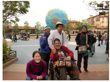
東京ディズニーランドにて