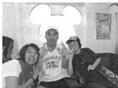
宮古島視察一行と建設中のピース宮古島 (仮名)